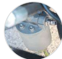
Fuel filter Filtro gasolio