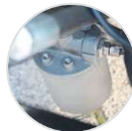
Fuel filter Filtro gasolio

24 V control panel. Quadro comandi in bassa tensione (24V).