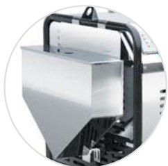
OPTIONAL S.S. Sand blasting tank Vaschetta sabbia